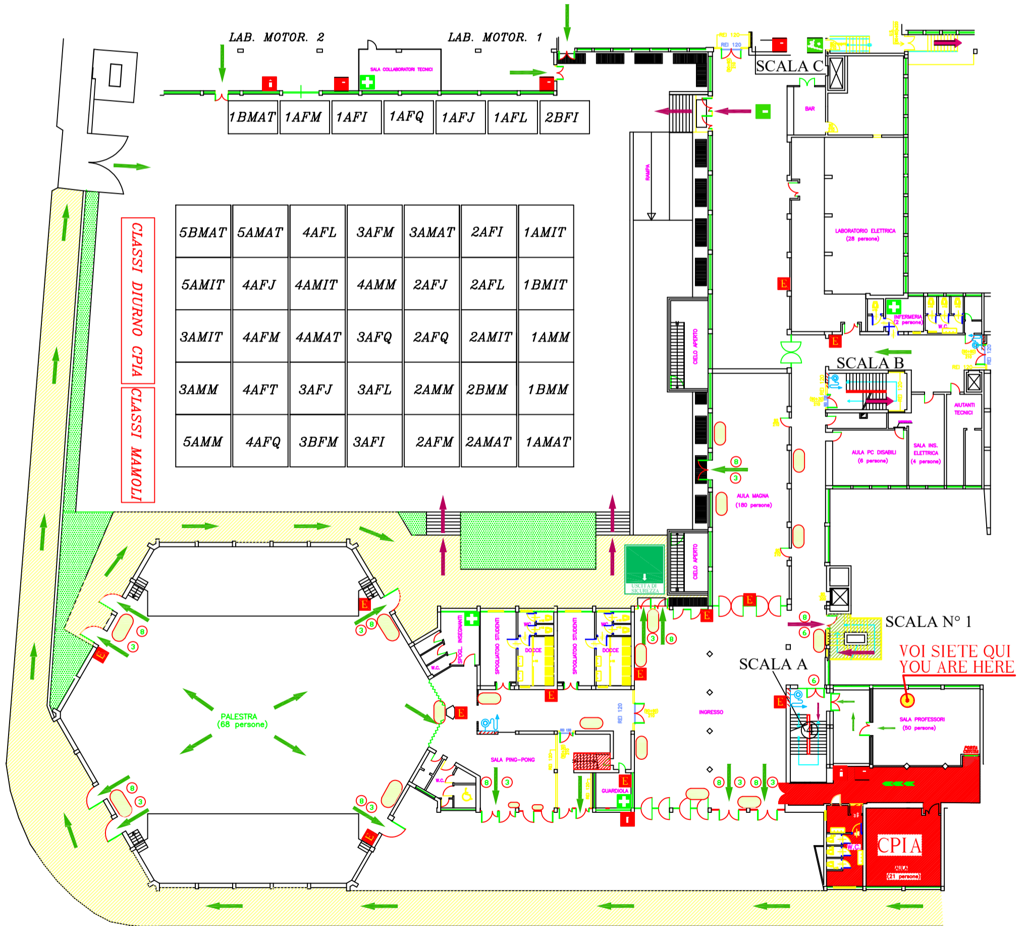
PIANTA PIANO TERRA DISPOSIZIONE CLASSI PUNTO DI RACCOLTA CLASSI DIURNO CORTILE DI FRONTE AL BAR